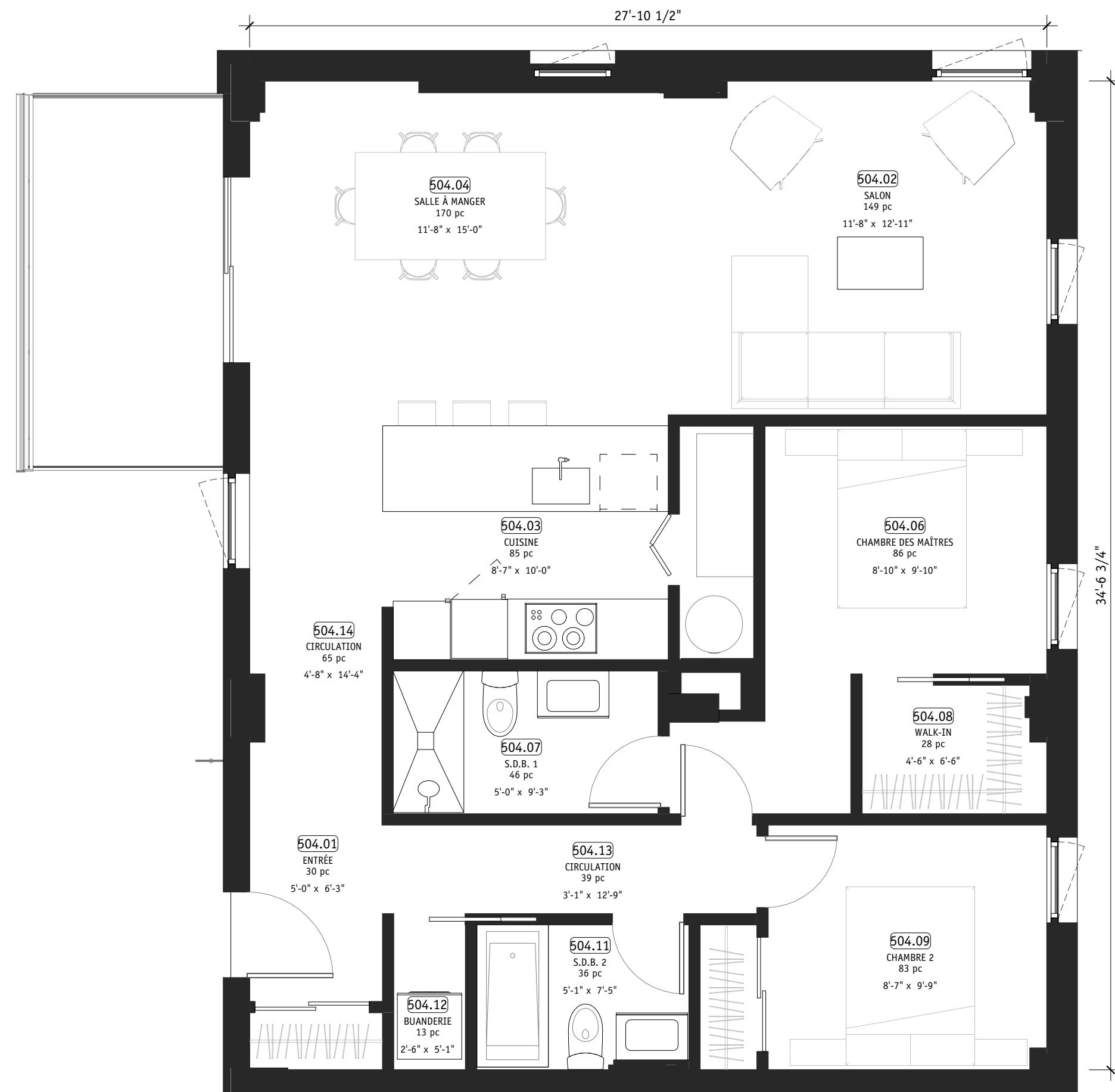
1 PLAN 504 - 5E ÉTAGE A164 1/4" = 1'-0"