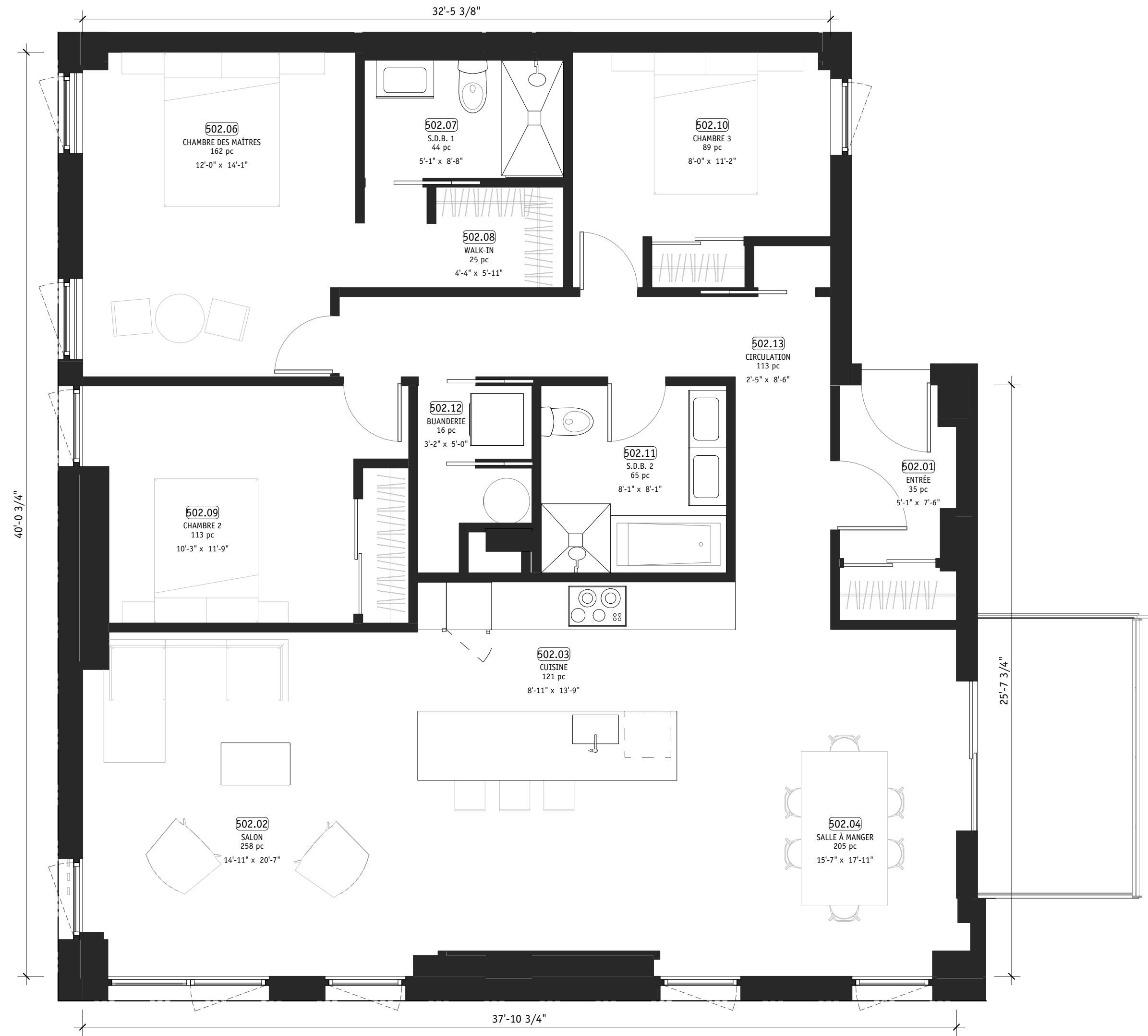
1 PLAN 502 - 5E ÉTAGE A162 1/4" = 1'-0"